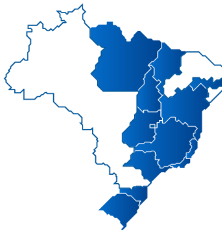
Mapa 1 – Área de atuação da BRK Ambiental