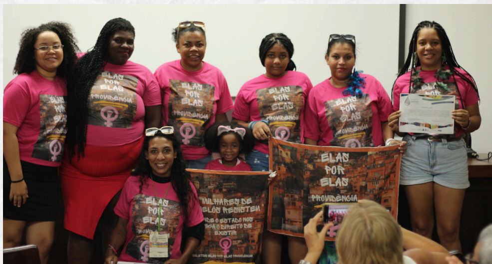
Militantes do Coletivo Elas por Elas, RJ

O II ENDHAS reuniu profissionais, estudantes, acadêmicos e movimentos sociais, mobilizados para debater o déficit do saneamento no país e a privatização do setor, que viola os direitos humanos à água e ao saneamento.