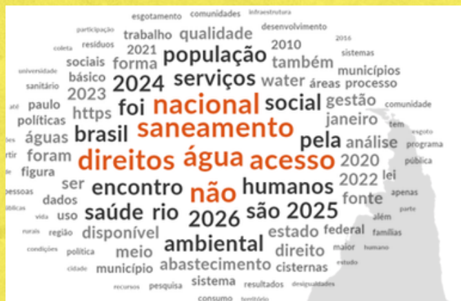
Nuvem de palavras dos trabalhos técnicos